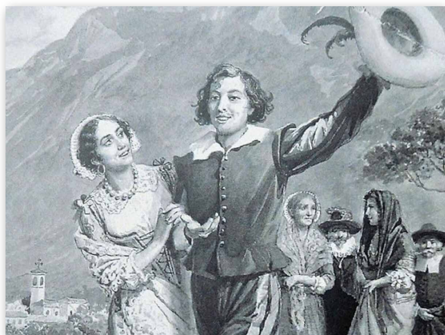
Renzo e Lucia, personaggi del romanzo di Alessandro Manzoni