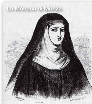
La Monaca di Monza

Ritrovo alle 15.00 davanti alla chiesa di Santa Margherita in Monza (via Santa Margherita-traversa di via Porta/Vittorio Emanuele) risalente al Settecento dopo la soppressione di San Maurizio e del suo convento dove visse Marianna De Leyva, la "Monaca di Monza". Gli affreschi di questa chiesa, pur essendo degradati per infiltrazioni di umidità, sono molto belli e importanti perché dipinti da Carlo Innocenzo Carloni, contemporaneo e rivale di Tiepolo. Al termine della visita trasferimento in Duomo dove Carloni ha decorato alcune navate. Partecipazione gratuita (guida a carico dell'U.P.M.).